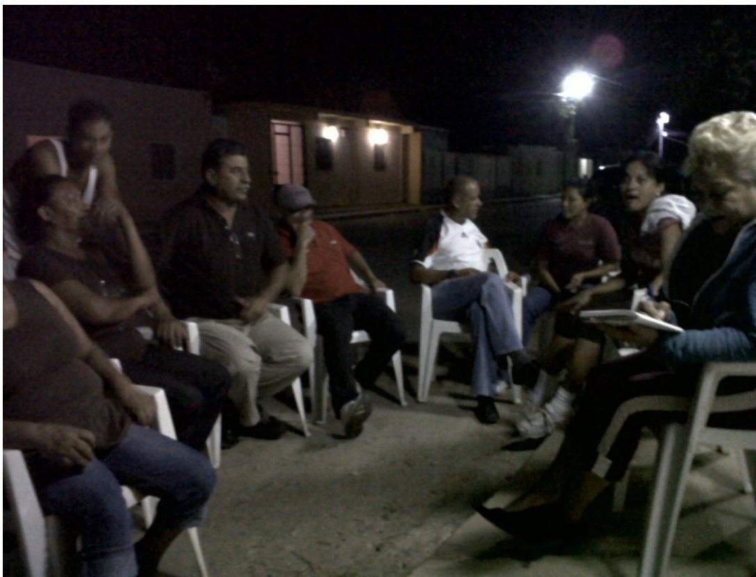
Asamblea de Ciudadanos