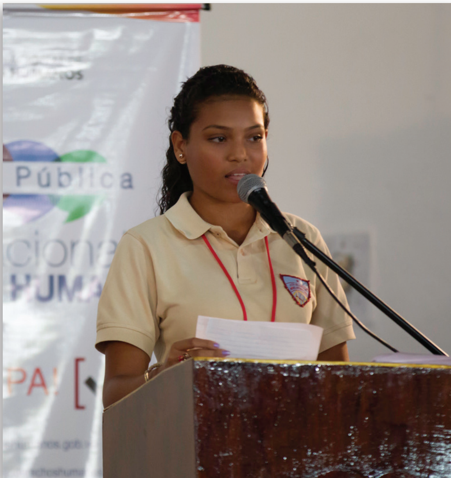
Consulta pública con estudiantes de Educación Media. Caracas, 13 de octubre de 2015.