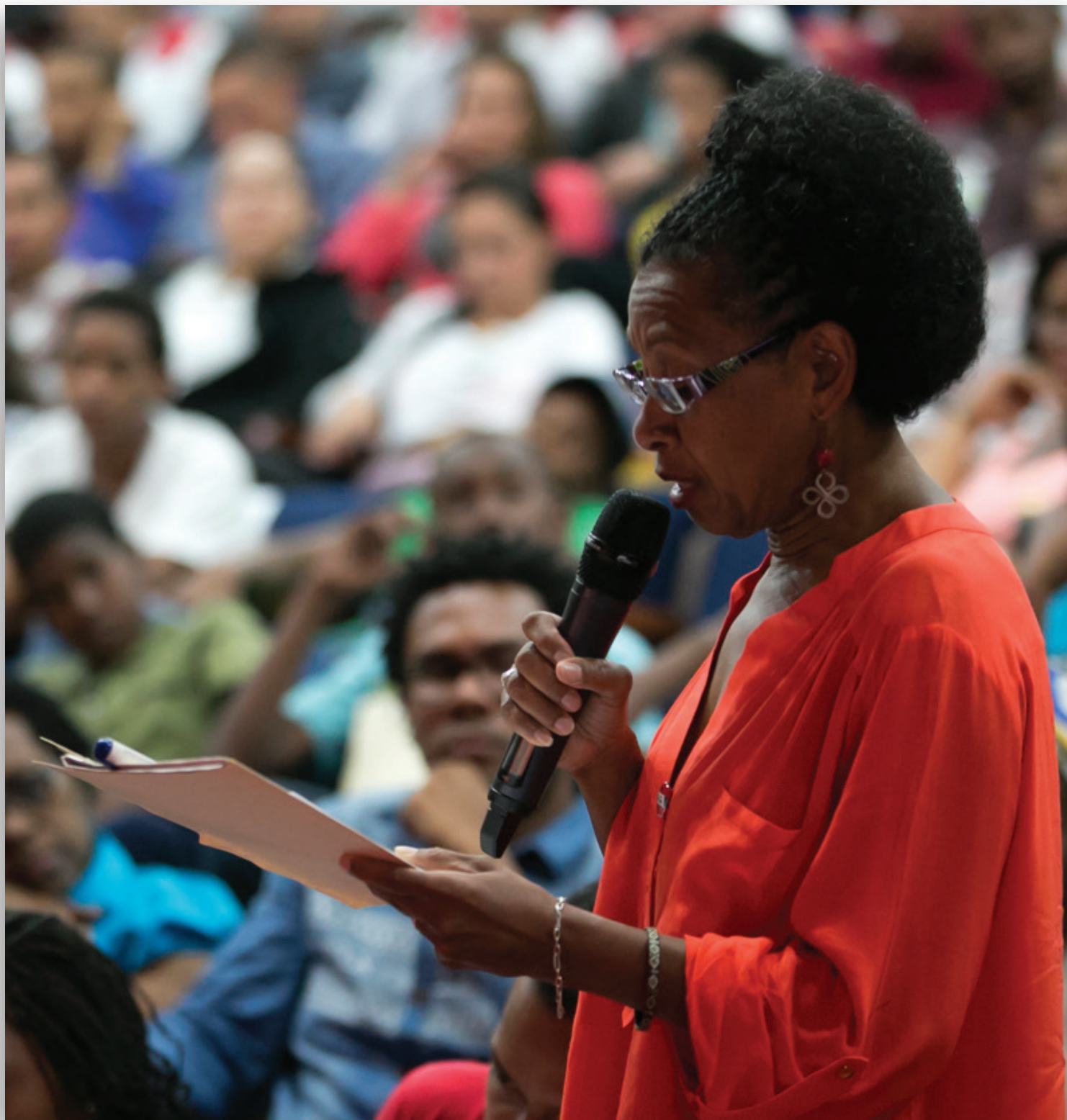
Intervención durante la consulta pública con movimientos afrodescendientes. Caracas, 14 de agosto de 2015.