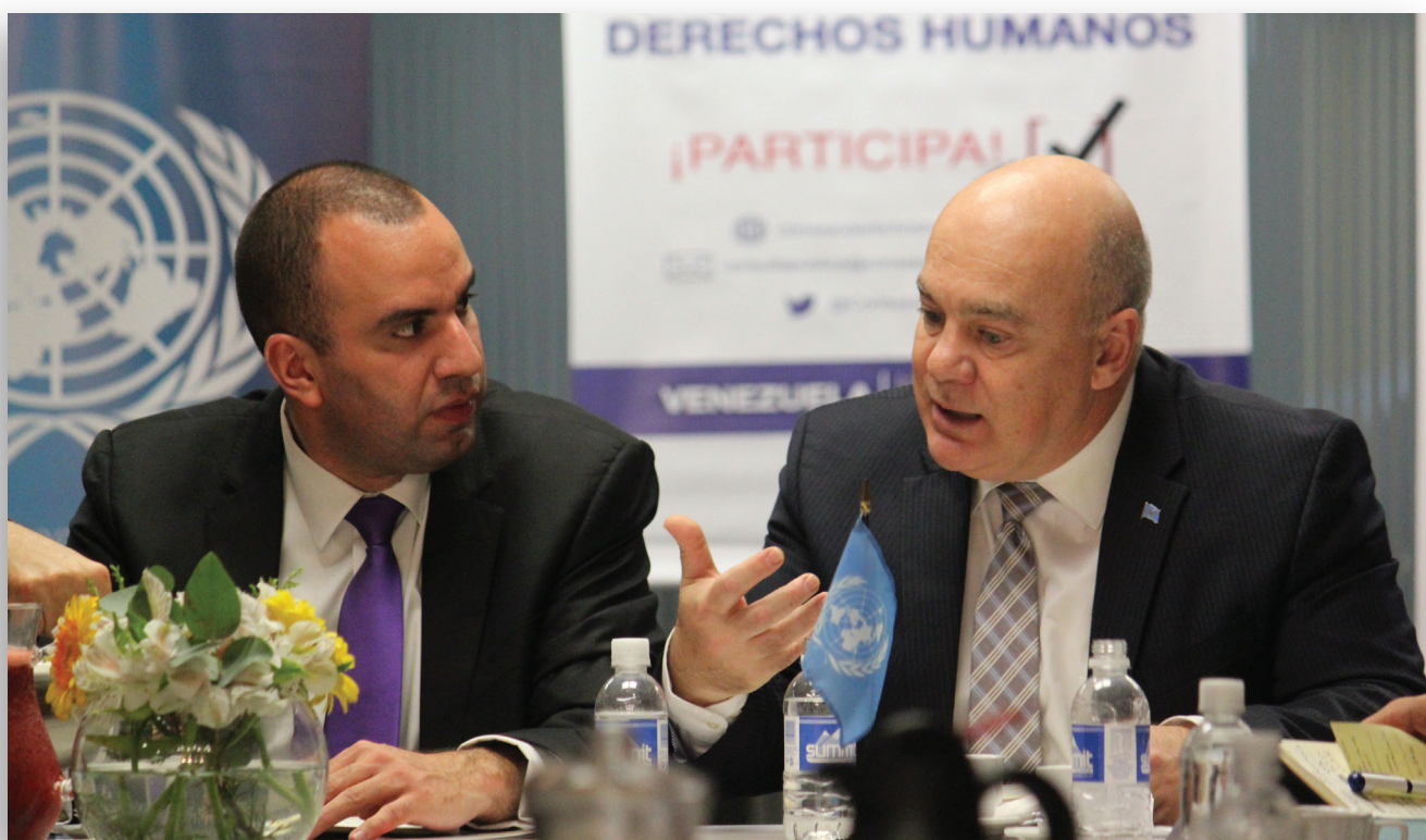
Consulta pública con Agencias del Sistema de Naciones Unidas acreditadas en Venezuela. Caracas, 21 de julio de 2015.