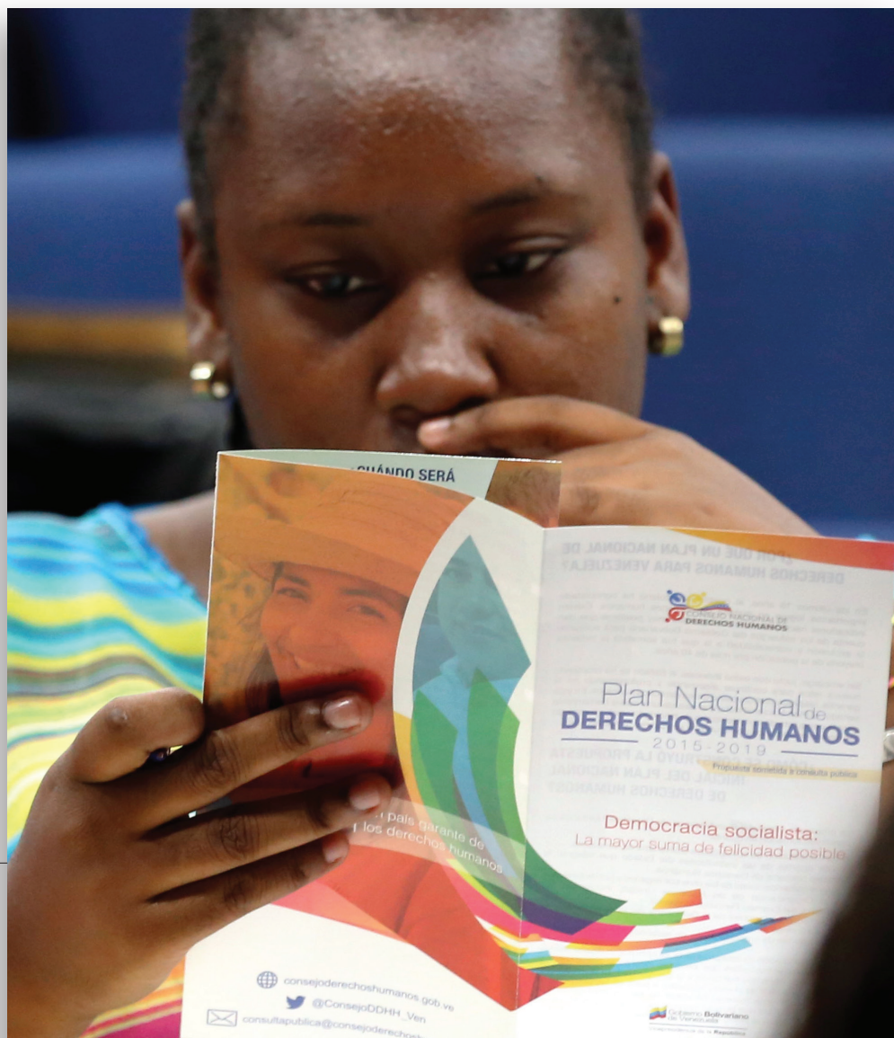
Consulta pública con movimientos afrodescendientes. Caracas, 14 de agosto de 2015.