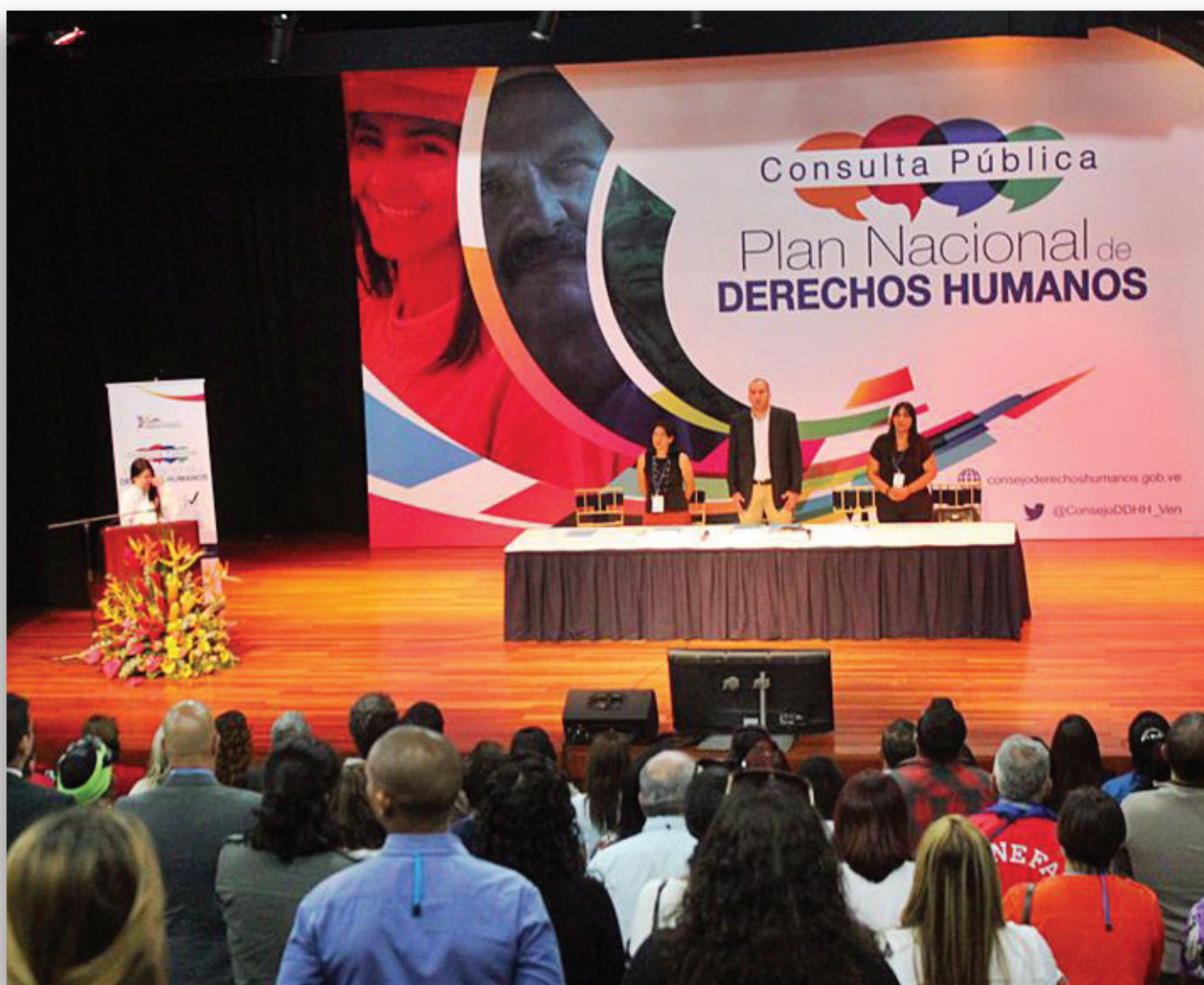
Consulta pública con organizaciones y movimientos de derechos humanos. Caracas, 27 de agosto de 2015.

El Plan Nacional de Derechos Humanos debe ser viable y realizable en el plazo previsto, y debe cumplirse e implementarse efectivamente.