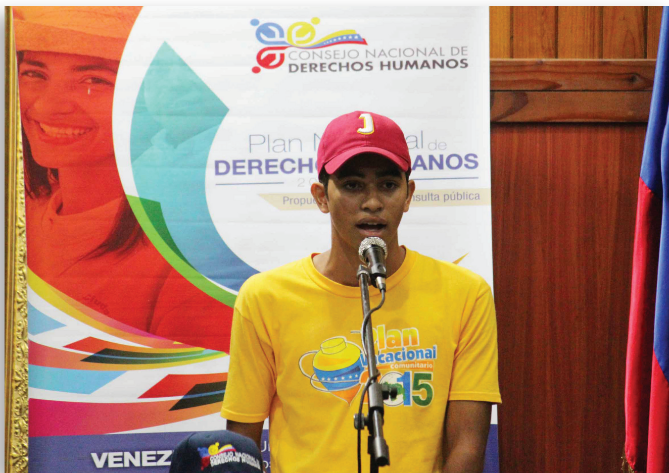
Consulta pública con adolescentes. Aragua, 24 de agosto de 2015.