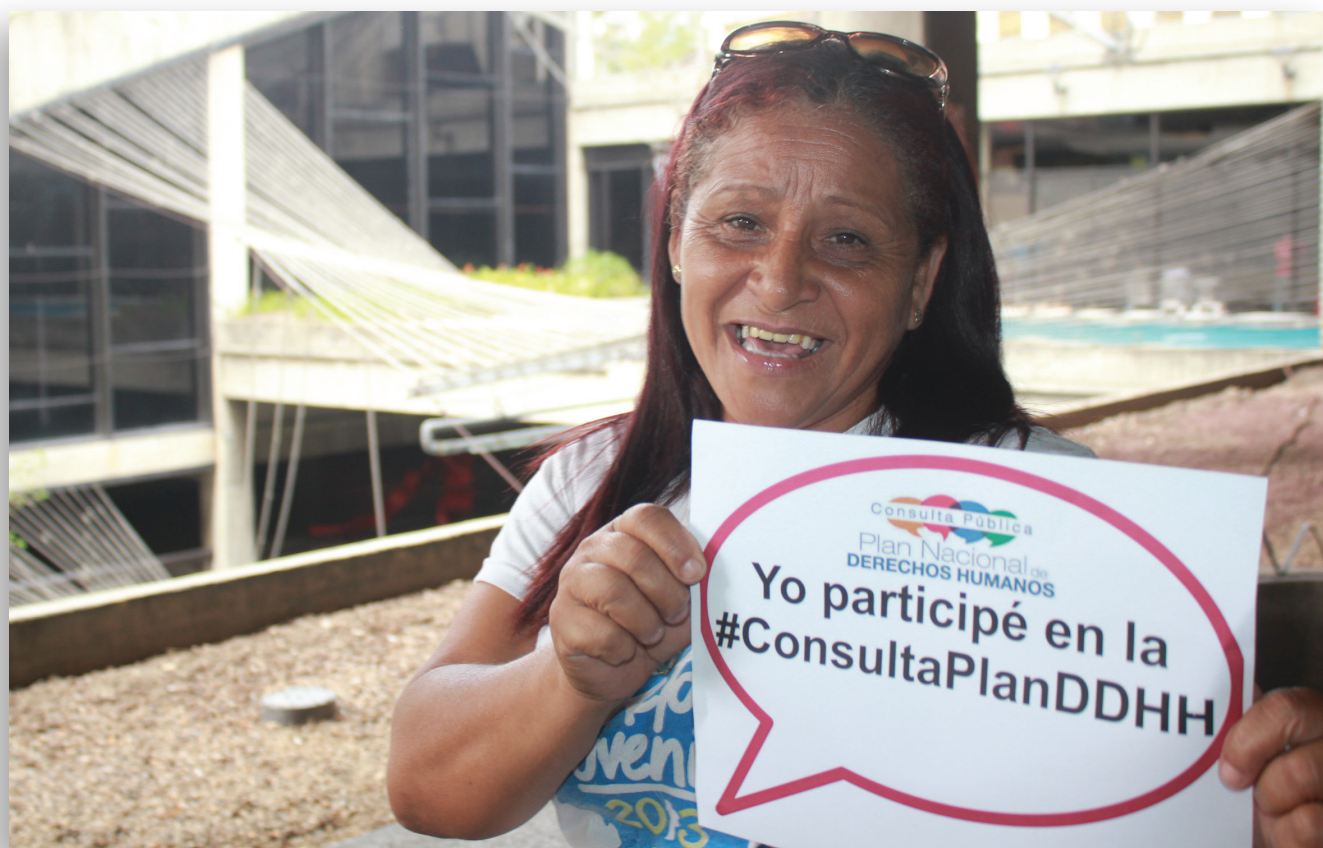
Consulta pública con movimientos de mujeres. Caracas, 12 de septiembre de 2015.